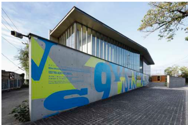
『ナイン・ヴィジョンズ | 日本から世界へ跳躍する 9 人の建築家』の会場、尾道市立美術館