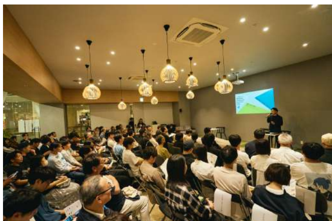
著名建築家たちによるトークイベント「プレミアートーク」